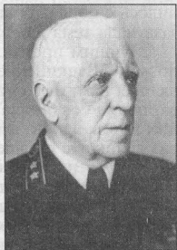
А. А. Скочинский

СКОЧИНСКИЙ Александр Александрович [1(13).7.1874, Олекма, Якутия – 6.10.1960, Москва], специалист в обл. горного дела, акад. АН СССР (1935). Герой Соц. Труда (1954). Лауреат Гос. премий СССР (1950, 1951). Окончил Петербург. горный ин-т (1900). Работал в этом ин-те (1906–1930) – проф. В 1930–1960 – проф. Моск. горного ин-та. В 1938–1960 – дир. ИГД АН СССР. В 1944–1951 – предс. ЗСФ АН СССР. Осн. труды посвящены проблемам рудничной аэрологии и связаны с вопр. безопасности при подземной разработке полезных ископаемых. Награжден пятью орд. Ленина, двумя орд. Труда, Кр. Знамени, медалями.