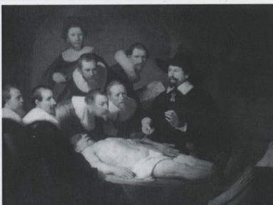
Иллюстрация на обложке: Rembrandt Harmenszoon van Rijn The Anatomy Lesson of Dr. Nicolaes Tulp (1632) Königliche Gemäldegalerie Mauritshuis Den Haag

© Коллектив авторов, 2006 © Оформление, А. А. Черноносков, В. В. Коваль, 2006 Königliche Gemäldegalerie Mauritshuis Den Haag