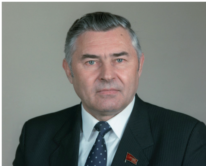
Академик Гурий Иванович Марчук (08.06.1925 – 24.03.2013)

Конференция АПВПМ-2015 посвящена 90-летию со дня рождения академика Гурия Ивановича Марчука. Г.И. Марчук – основатель и первый директор Вычислительного центра СО АН СССР (ныне Институт вычислительной математики и математической геофизики СО РАН), основатель и первый директор Института вычислительной математики РАН, Председатель Сибирского отделения АН, Председатель Госкомитета по науке и технике СССР, Президент Академии наук СССР, Председатель Межведомственного научно-технического совета по космическим исследованиям при Академии наук СССР, Герой Социалистического труда, лауреат Ленинской и Государственных премий.